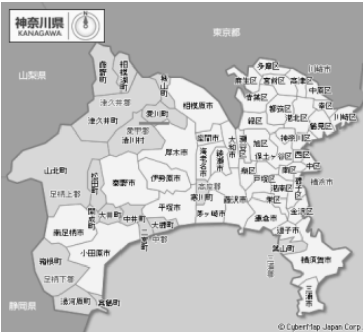
地図1 愛川町と神奈川県の自治体

愛川町は神奈川県中央北部に位置し、自然に囲まれた緑豊かな町である。以下に県内における愛川町の位置を示す(地図1)。