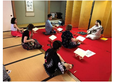
▲過去の開催の様子（三味線）