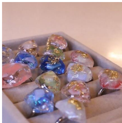
▲海洋プラスチックを使用した ハンドメイドの指輪