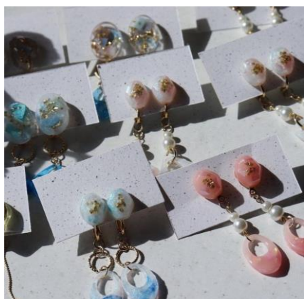
▲海洋プラスチックを使用した ハンドメイドのピアス

【ハあん Instagram】 https://www.instagram.com/haean_pla_acc/