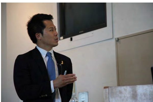
▲朴室長/専任講師による国際大会におけるボランティア活動の意義