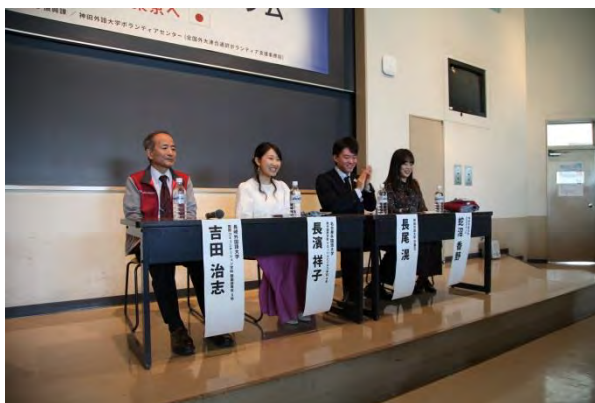
▲長崎外国語大学、名古屋外国語大学の学生も参加