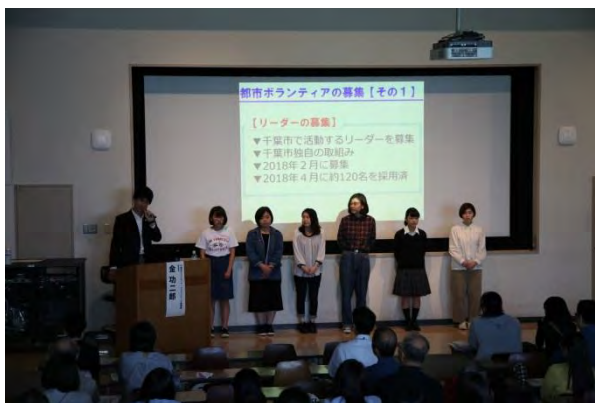
▲千葉県オリンピック・パラリンピック振興課による講演