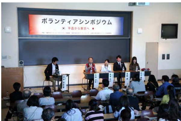
▲全国外大生によるパネルディスカッション