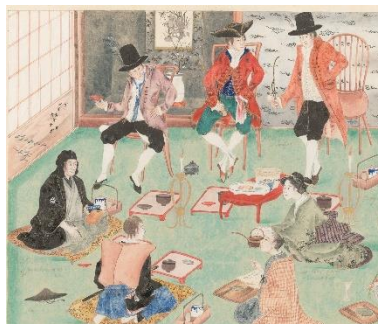
▲桂川甫賢筆 長崎屋宴会図