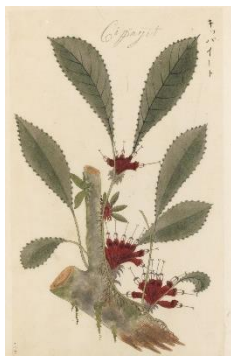
▲ジャワ植物図譜 宇田川榕菴写