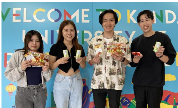
▲ 福島ブース担当の学生と選定商品

【浜風祭特設サイト】 https://www.kandagaigo.ac.jp/kuis/main/campuslife/hamasai/