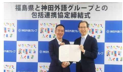
▲ 包括連携協定締結式の様子 (2023年9月8日撮影)

本協定の一環として福島県庁の職員の方々と協力した学園祭での福島ブ ースの出店は、連携協定を締結した昨年からはまり、今年で2年目となり ます。今回も、企画から運営まで学生が主体となり、学生時代に力を 入れたこと(ガクチカ)としての体験となるような挑戦に取り組んでいます。