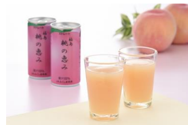
▲販売商品イメージ：写真左から、会津チーズ饅頭くいちい、工芸品「赤べこ」、桃の恵み(ジュース)