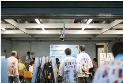
▲ 福島ブースイメージ