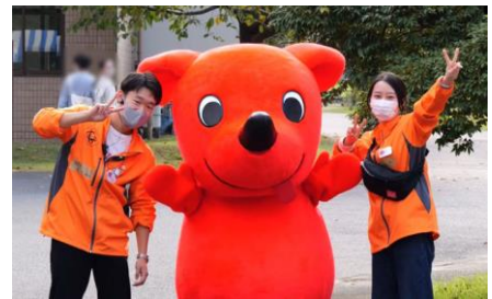
▲ 千葉県マスコットキャラクター チーバくん