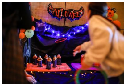
▲ ハロウィン縁日イメージ